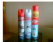
spuitbussen met insecticide op het aanrecht

Snij- en steekwonden – verdrinking – vergiftiging – elektrische schok of electrocutie – brand en brandwonden – val van een hoogte – bekneld geraken – val op gelijke hoogte